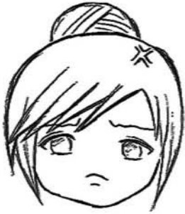
受害人- 市民 A